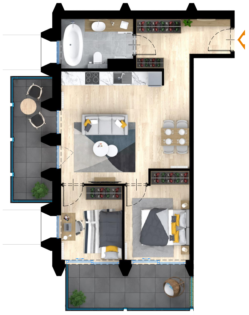
RZUT MIESZKANIA WYKOŃCZONEGO