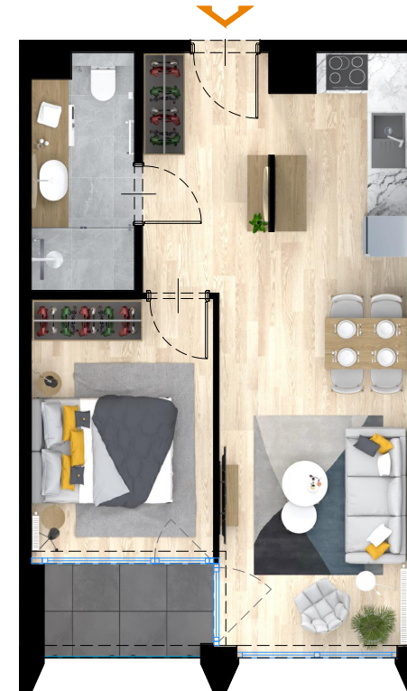
RZUT MIESZKANIA WYKOŃCZONEGO